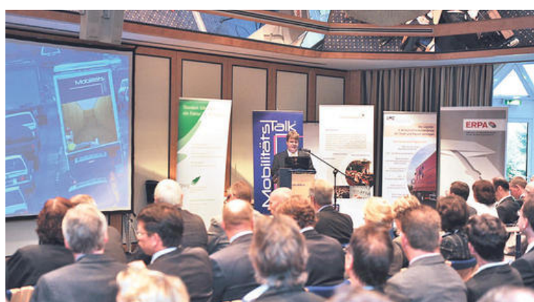
16. Mobilitätstalk im Hotel Freizeit In: Nach den Vorträgen wurde beim Essen bis morgens um 2 Uhr diskutiert.

Mitarbeiter erscheinen aufgrund des morgendlichen Verkehrsstaues gestresst am Arbeitsplatz. Die Parkplätze auf dem Firmengelände reichen nicht aus. Radwege sind zugeparkt. Die Anbindung an den Öffentlichen Personennahverkehr (ÖPNV) ist schlecht.